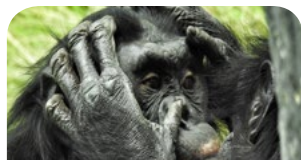
Wird schon werden - Seite 6