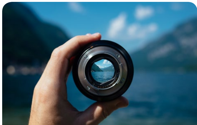
Perspektiven ... - Seite 4