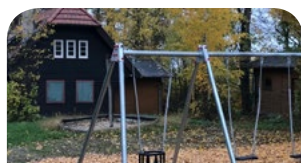
Jugendheim Geroldseck- S. 10