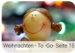
Weihnachten - To -Go- Seite 15