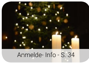
Anmelde- Info - S. 34