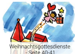
Weihnachtsgottesdienste Seite 40-41