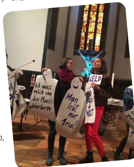
Bilder vom Jahreslosungstheater „Die (Un-)glaublichen“ 2020