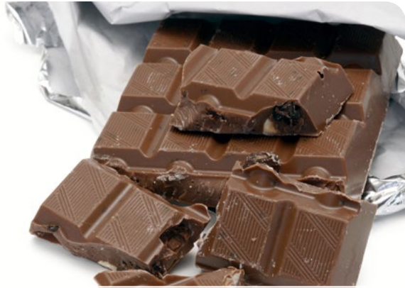
Fasten - Zeit für das richtig Wichtige ... - Seite 4