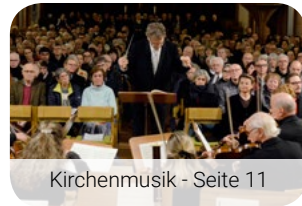
Kirchenmusik - Seite 11