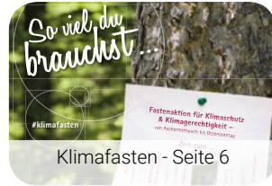
Klimafasten - Seite 6