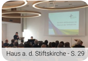
Haus a. d. Stiftskirche - S. 29