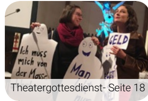
Theatergottesdienst- Seite 18