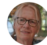
Ihre Monika Esken

Ich danke Herrn Fiehn für seine Offenheit und bin zuversichtlich, dass sich seine Wünsche zumindest teilweise erfüllen werden!