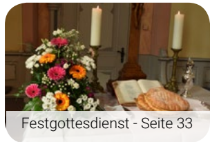
Festgottesdienst - Seite 33