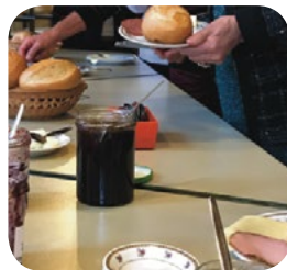
Eindruck von dem ersten Seniorennachmittag. Das nächste Frühstück ist am 13.02.

Auch die Kinonachmittage im GZ Philipp Melanchthon dauern von 15 bis 17 Uhr. Wenn Sie möchten, bringen Sie gerne etwas zu knabbern mit. Der Eintritt ist natürlich frei, alle Senioren aller Predigtbezirke sind herzlich dazu eingeladen. Im Schaukasten erfahren Sie zeitnah, welche Filme jeweils gezeigt werden.