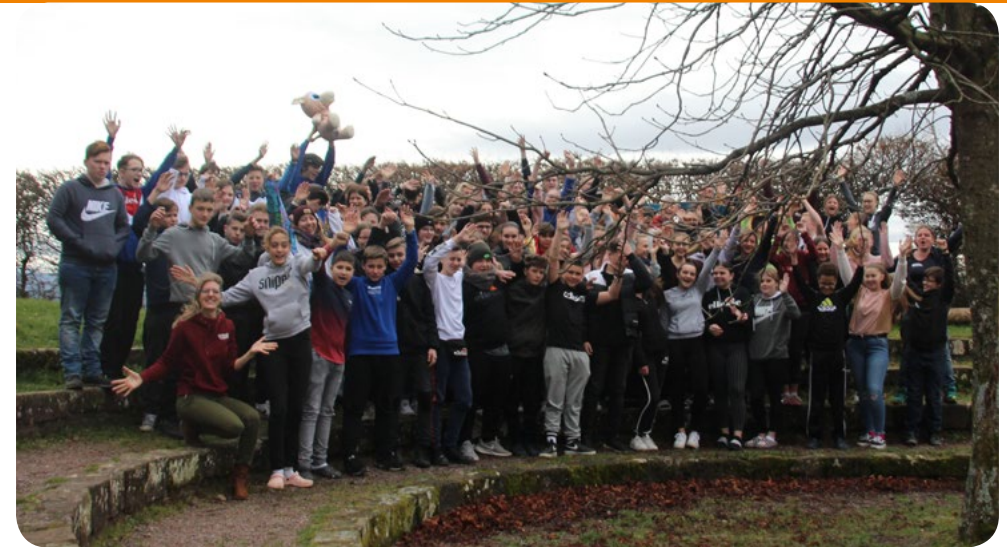
Konfirmandenfreizeit 2020 mit Konfirmanden aus ganz Lahr.