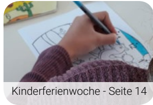
Kinderferienwoche - Seite 14