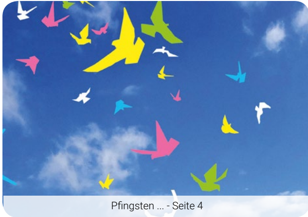
Pfingsten ... - Seite 4