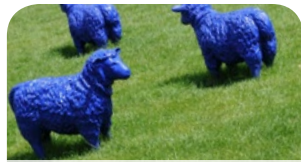
Outdoor-Gottesdienste- S. 10