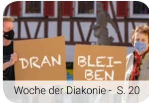
Woche der Diakonie - S. 20