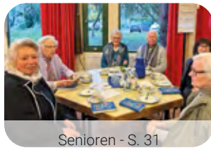
Senioren - S. 31