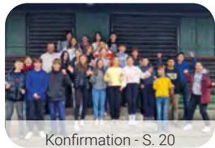
Konfirmation - S. 20