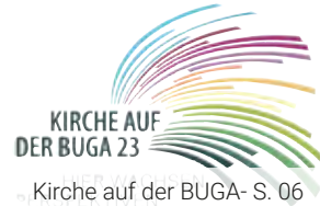
Kirche auf der BUGA- S. 06