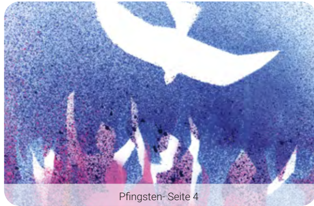
Pfingsten- Seite 4