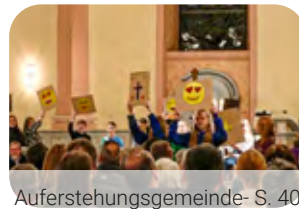
Auferstehungsgemeinde- S. 40