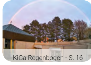
KiGa Regenbogen - S. 16