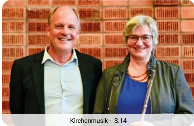
Kirchenmusik - S.14