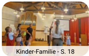
Kinder-Familie - S. 18