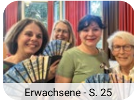
Erwachsene - S. 25