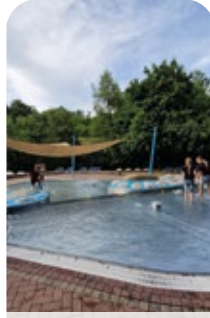
Bezirksjugend - S. 22