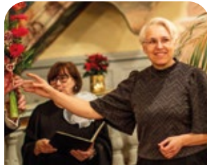
Auferstehungsgemeinde- S. 33